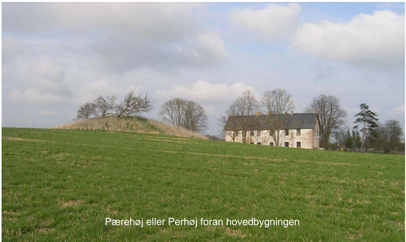
Pærehøj eller Perhøj foran hovedbygningen