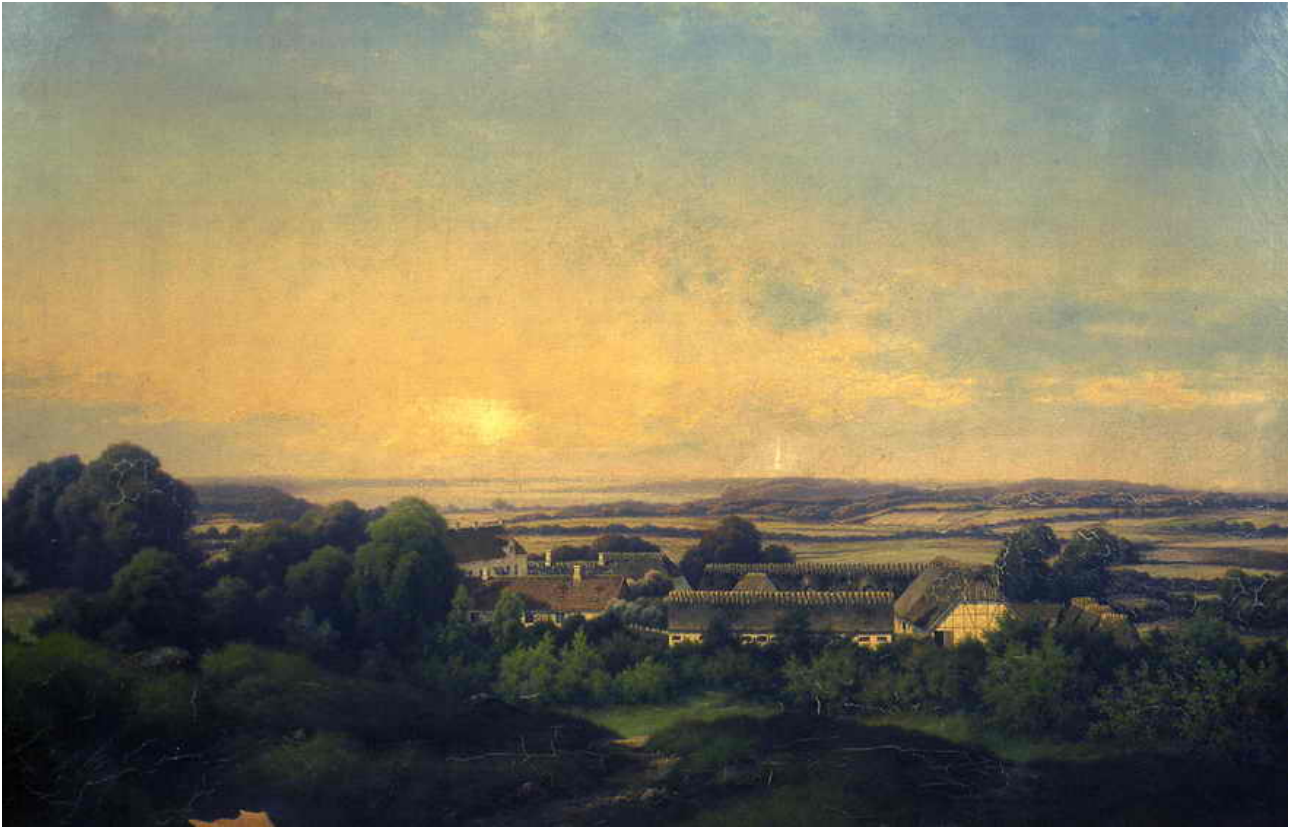
Maleri af Trudsholm fra 1800 tallet.