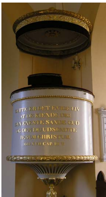
Prædikestolen er cylindrisk og fra 1824

Indre Sæby kirkes interiør er usædvanligt for en landsbykirke af en så agtværdig alder. Vi står i en kirke, hvor første halvdel af 1800-tallets stilsans står næsten uforstyrret af tidligere tiders påvirkning, og adskillige af dansk guldalders og nyklassicismes store kunstnere har bidraget til genopbygningen.