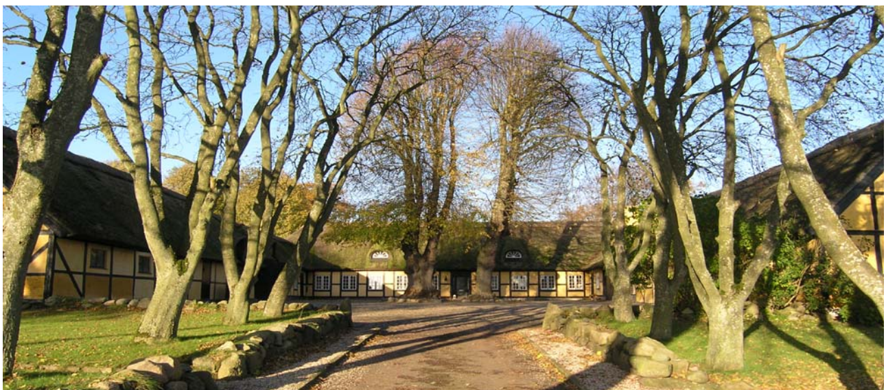
Ved siden af kirken ligger den velbevarede præstegård fra 1826

Klokker En klokke støbt 1688 og bekostet af Otto Skeel og Christine Bille med deres våben. En klokke støbt 1858. Ved klokkeskatten 1528 afleveredes en klokke og 1602 endnu en.