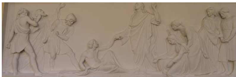
Billedhuggeren Bissen har lavet de to gipsrelieffer, der sidder i kirkeskibets væg.