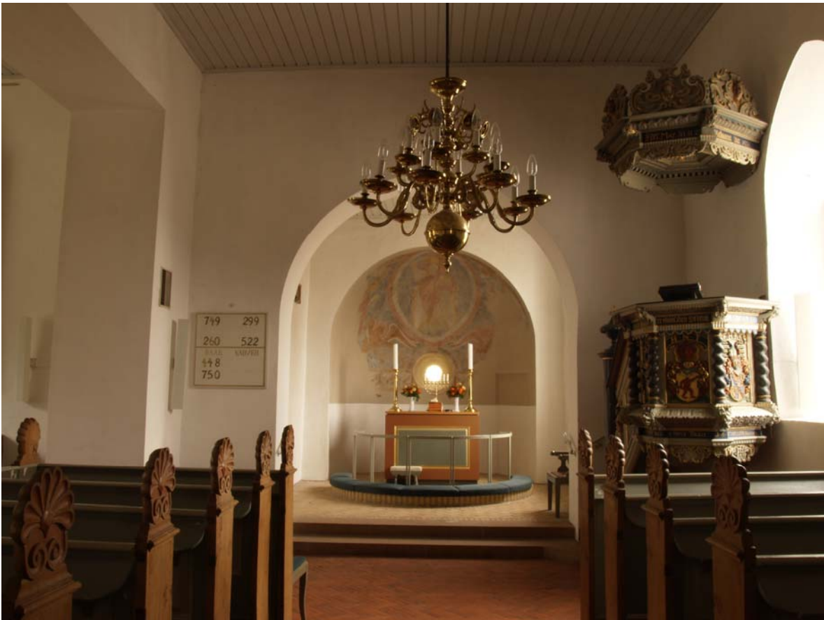
Indre Skib og kor har bjælkeloft.