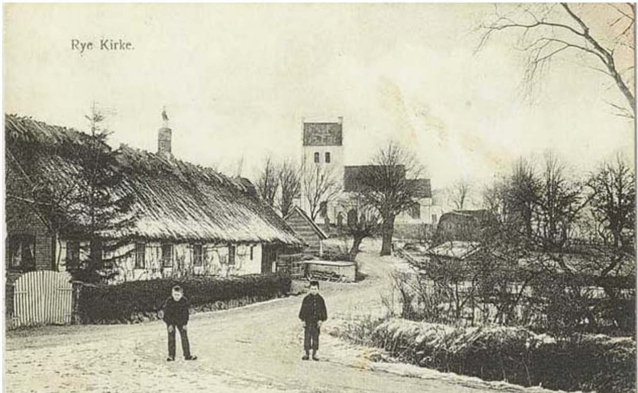
Rye med kirken i baggrunden på et postkort fra 1906