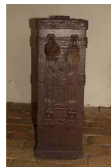
Pengeblok fra 1650 med siksakmønster på jernbåndene og helt jerndækket.