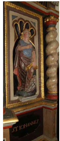
De fire evangelister: Mathæus med barnet, Marcus med løven. Lucas med oxen og Johannes med en ørn