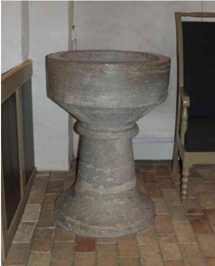
Døbefont er senromansk og af gotlandsk kalksten, keglestubbyten.