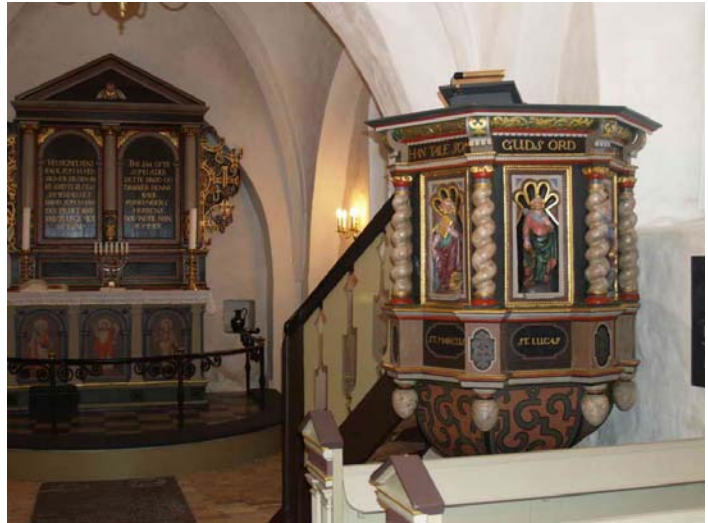
Prædikestolen er leveret til Rorup i 1659. Den er formodentlig lavet af Caspar Lubbeke.