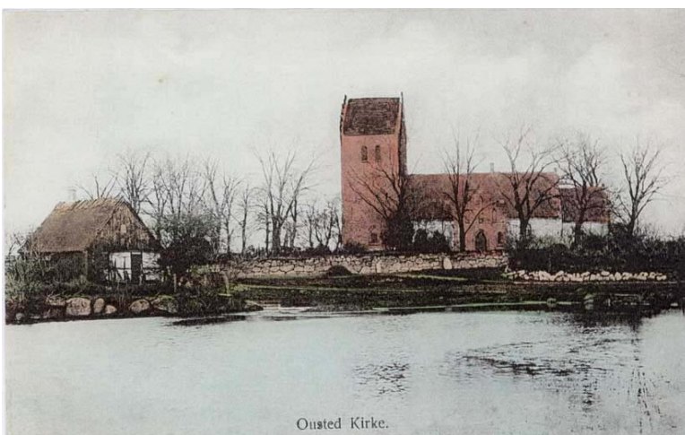
Postkort fra Flensborgs boghandel fra 1905

Klokker I tårnet er der to klokker, den ældste og største er støbt af Gerhardt van Mervelt i 1588, tværmålet er 115 cm. Den mindste med et tværmål på 85 cm er støbt af Borehardt Quellichmeier i 1608 Ved klokkeskatten i 1528 måtte kirken aflevere en klokke.