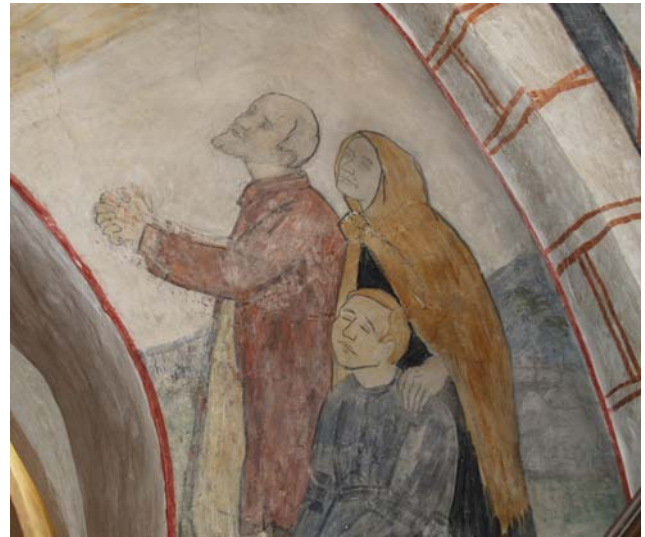
På triumfvæggen, i korbuen og på syd vægen er malerier af Ole Søndergaard fra 1923. Personerne på malerierne skulle have stor lighed med kendte personer fra Osted.