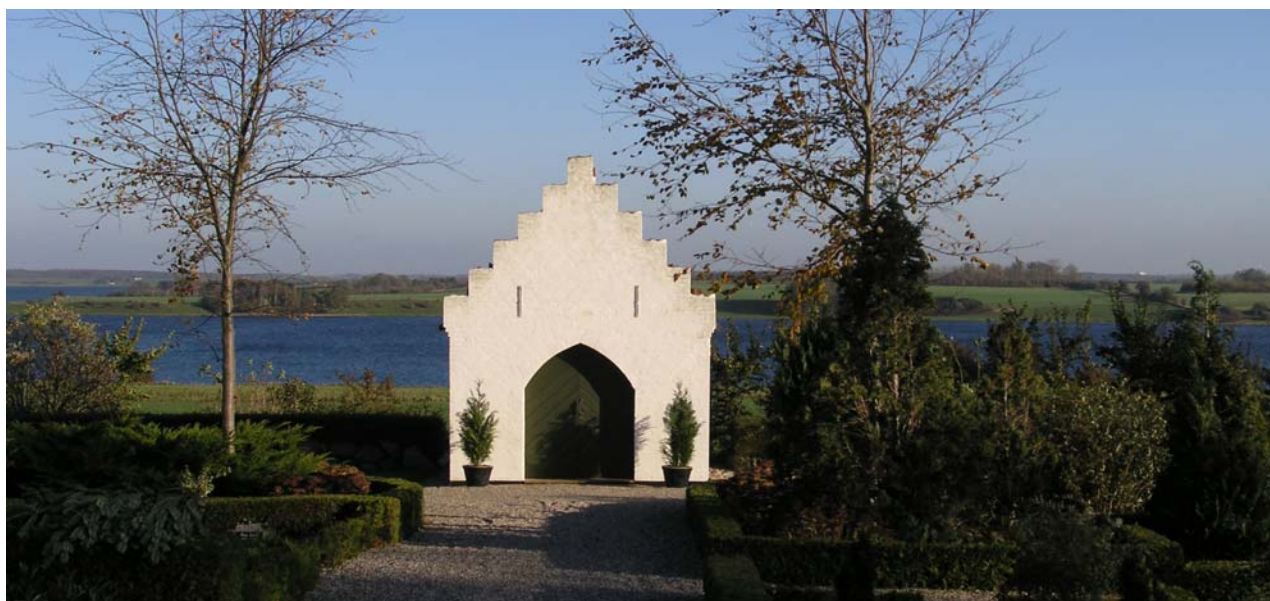
Kirkegården ud til Lejre Vig