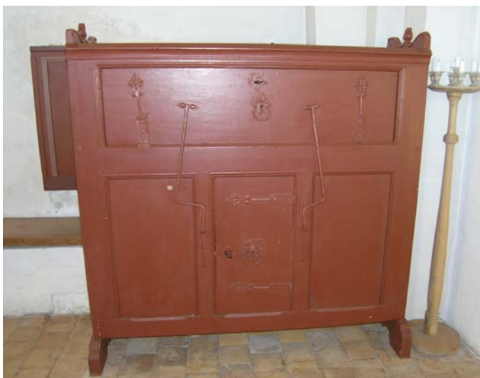
Degnestol med tre fydninger, hvoraf den midterste kan åbnes som en låge. Øverst en klap som kan lukkes ned og støtte på to jernstivere.