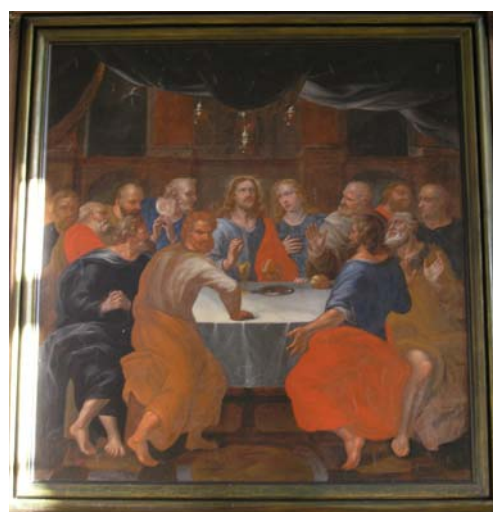
Altertavle med motiv fra Nadveren