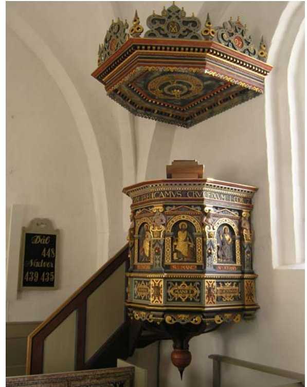
Prædikestol fra 1597 af Oluf Krog