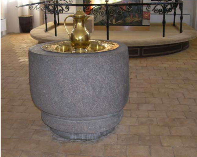
Døbefont er romansk og af granit