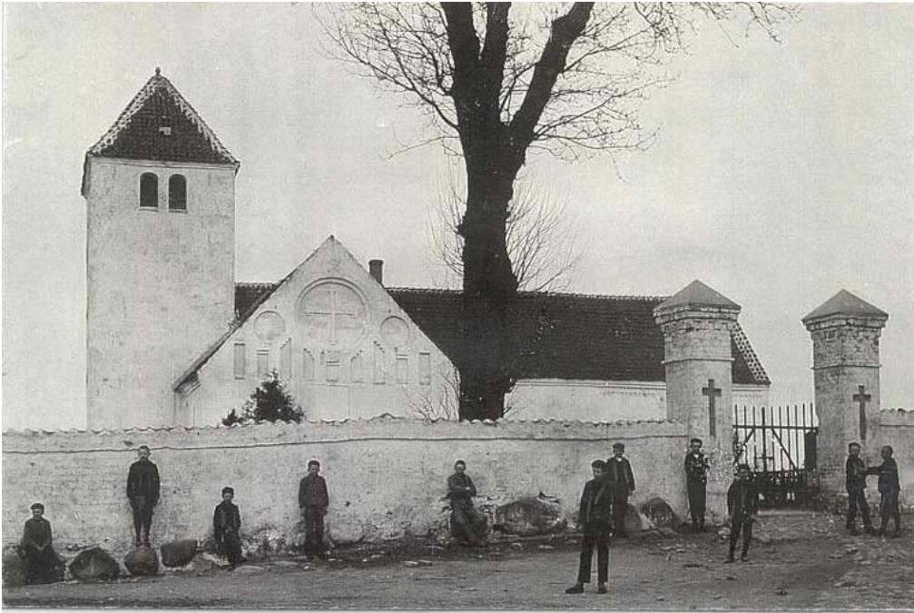
Kirke Saaby Kirke 1906