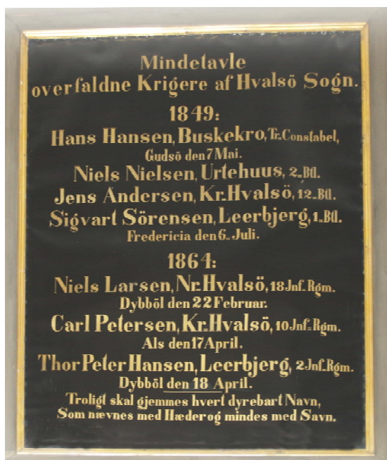
Mindetavle for faldne fra Hvalsø

Kirkeskib fra 1722. Det siges at skibet er skænket af en fra sognet, som var i havsnød.