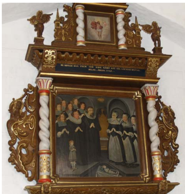
Provst Peder Laursøn Wolleires epitafium

Sagn "En fæl lindorm lå og spærrede vejen til kirkens sydlige indgang. Til sidst blev det bymændene for meget, og de opfedede en tyr med sødmælk og nøddekerner til at kæmpe mod den. Det blev en frygtelig kamp, men til sidst fik tyren dog bugt med udyret".