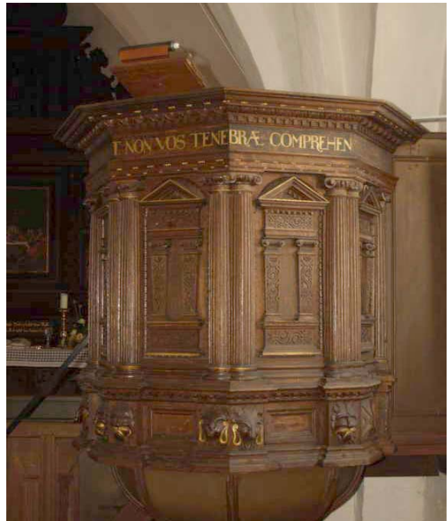
Altertavle, prædikestol og det meste af træværket i kirken er fra 1665 og fra Caspar Lubbekes værksted i Roskilde. Efter opstillingen var der en strid om prisen på træarbejdet.