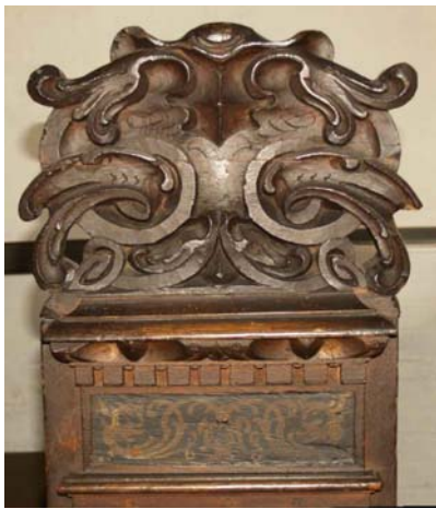
Stolegavl af Caspar Lubbeke