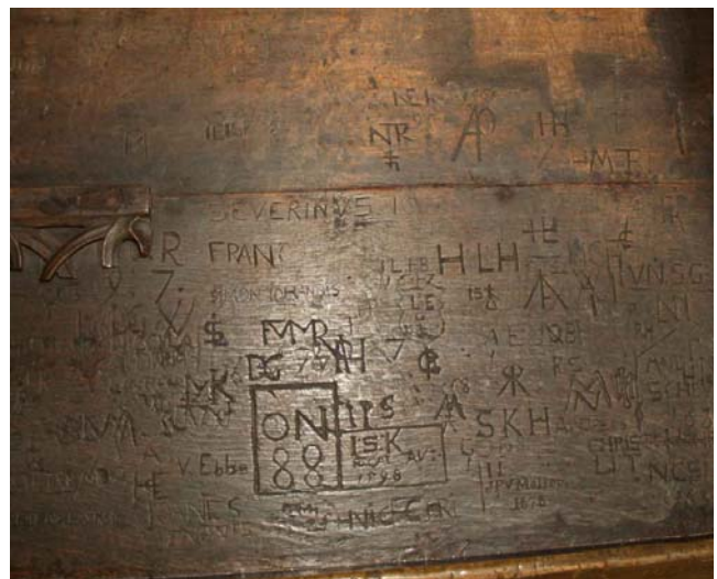
Degnestol fra omkring 1550. Den har indsnittede navne, bomærker og årstal. Det ældste er fra 1562. De er lavet af latinskoledrenge fra Roskilde, "løbedegne", som i årene efter reformationen blev sat til at passe degnebestillingen i Glim.