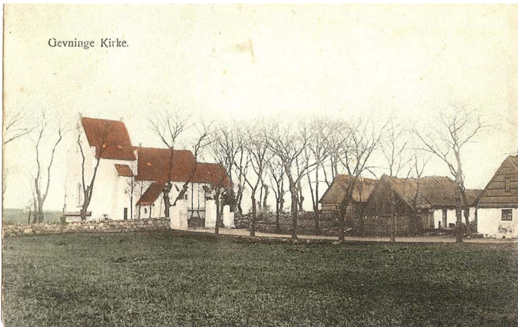
Gevninge Kirke omkring år 1900.

Sagn: Braëm kørte efter sin død hver nat fra gravkapellet til Lindholm. Optegnelse i dansk folkemindesamling.