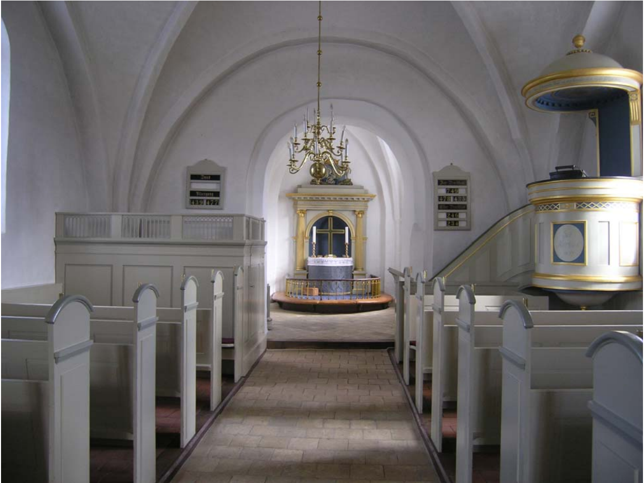
Kirkens indre er i empire og fra 1806. Det gælder prædikestol, alterbord, stoleværk, præstestol og døbefont.