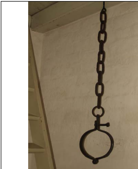
"Gabestokken" som hænger i våbenhuset