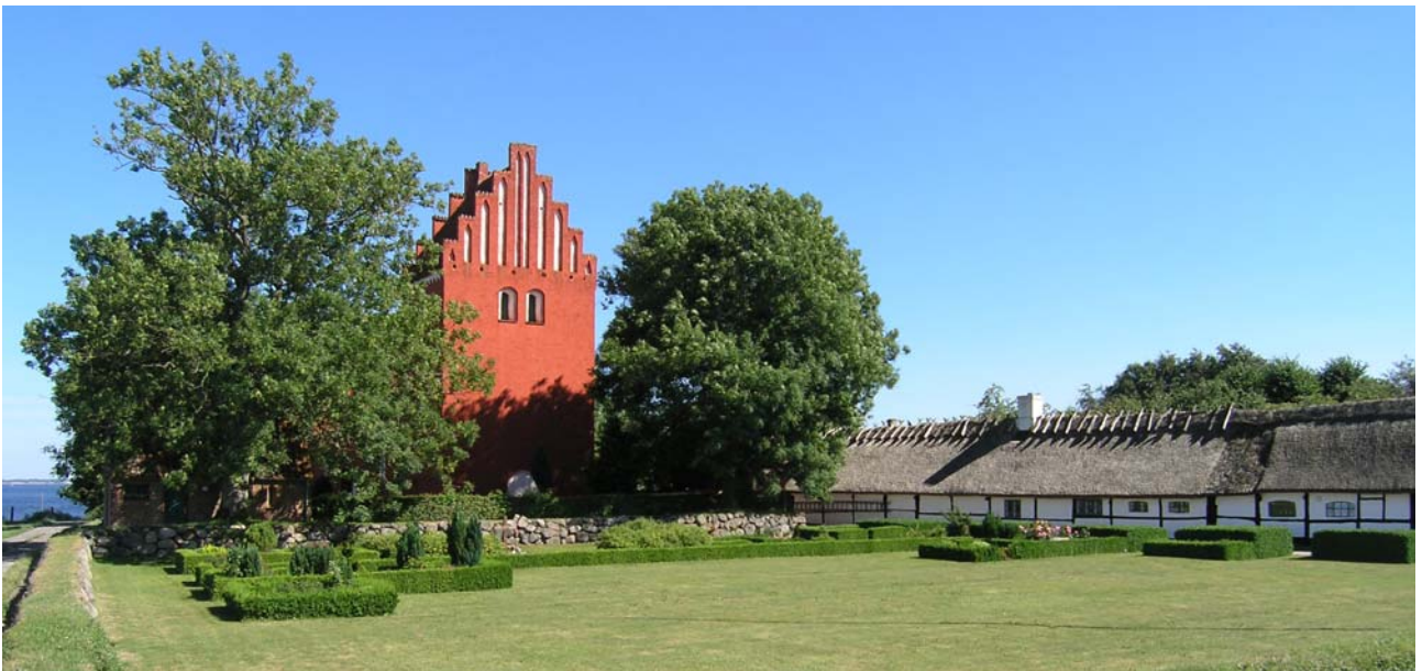
Gershøj Kirke med Roskilde Fjord i baggrunden.

En klokke fra 1732 støbt af J. B. Holtzmann. På klokkelegemet står: "Herr Geheimeraad Otto Krabbe Frue Birte Scheel".