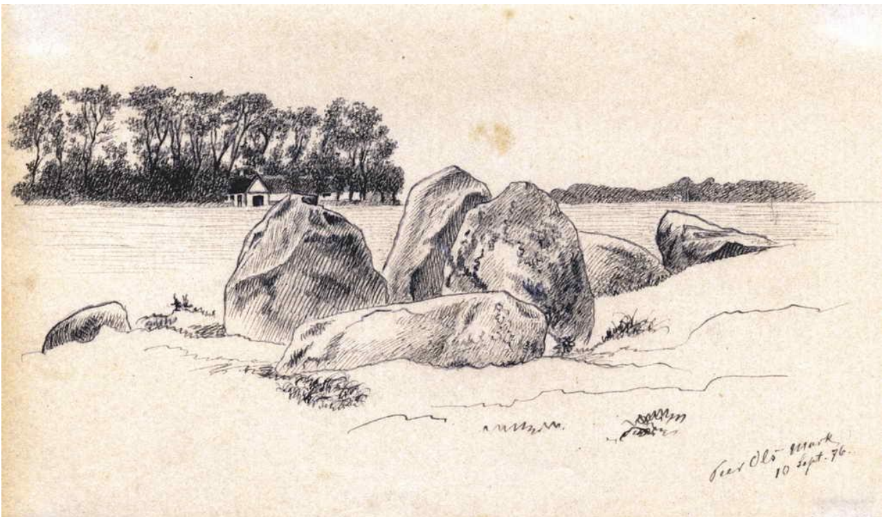
Chr. Bayers akvarel fra den 10. september 1876. I baggrunden ser man Elmegård.