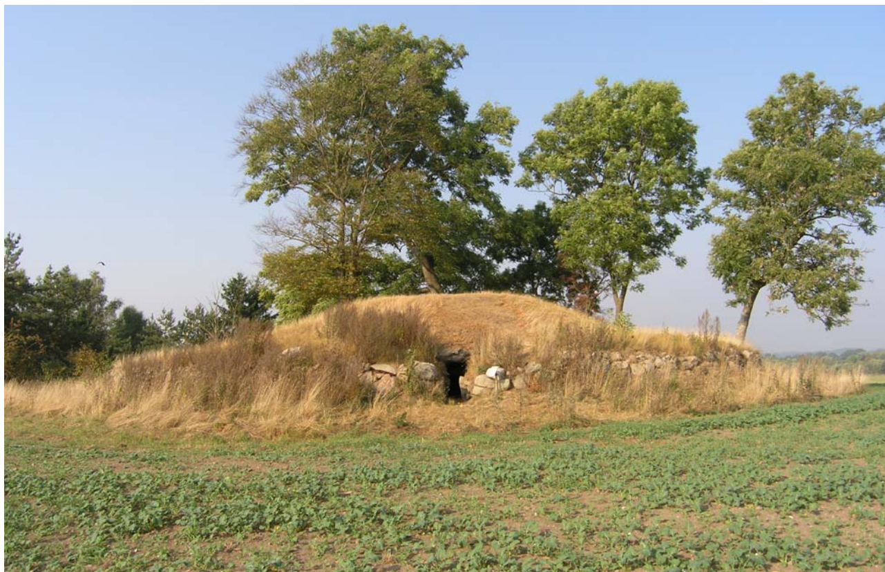
Jættestue, 16 x 16 x 5 m. Stengærde fra 1800 omkring højen.

Fredningsnummer 3226-66 Sognebeskrivelse 020402-13