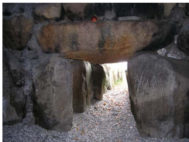
Kammer 7 x 1,8 m med 15 bæresten og 4 dæksten.