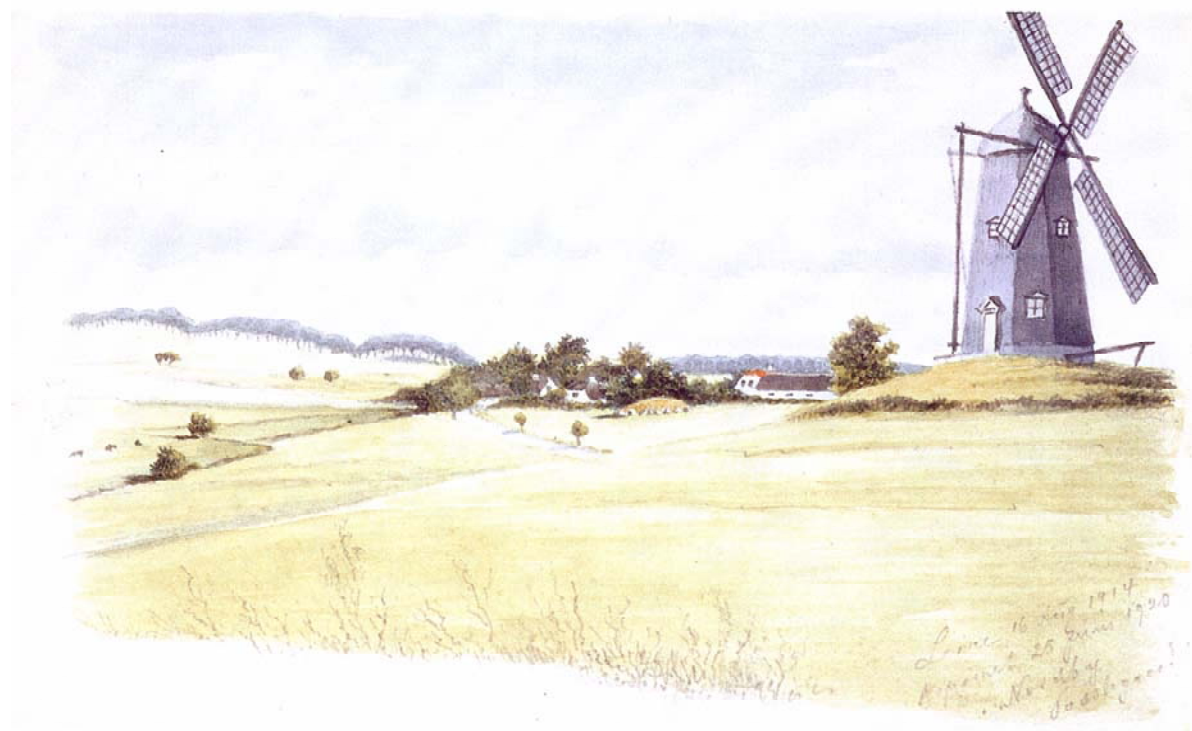
Christian Bayers billede af Møllehøj med vindmøllen fra 1914. I baggrunden ses Gl. Lejre og yderst ude Alléen