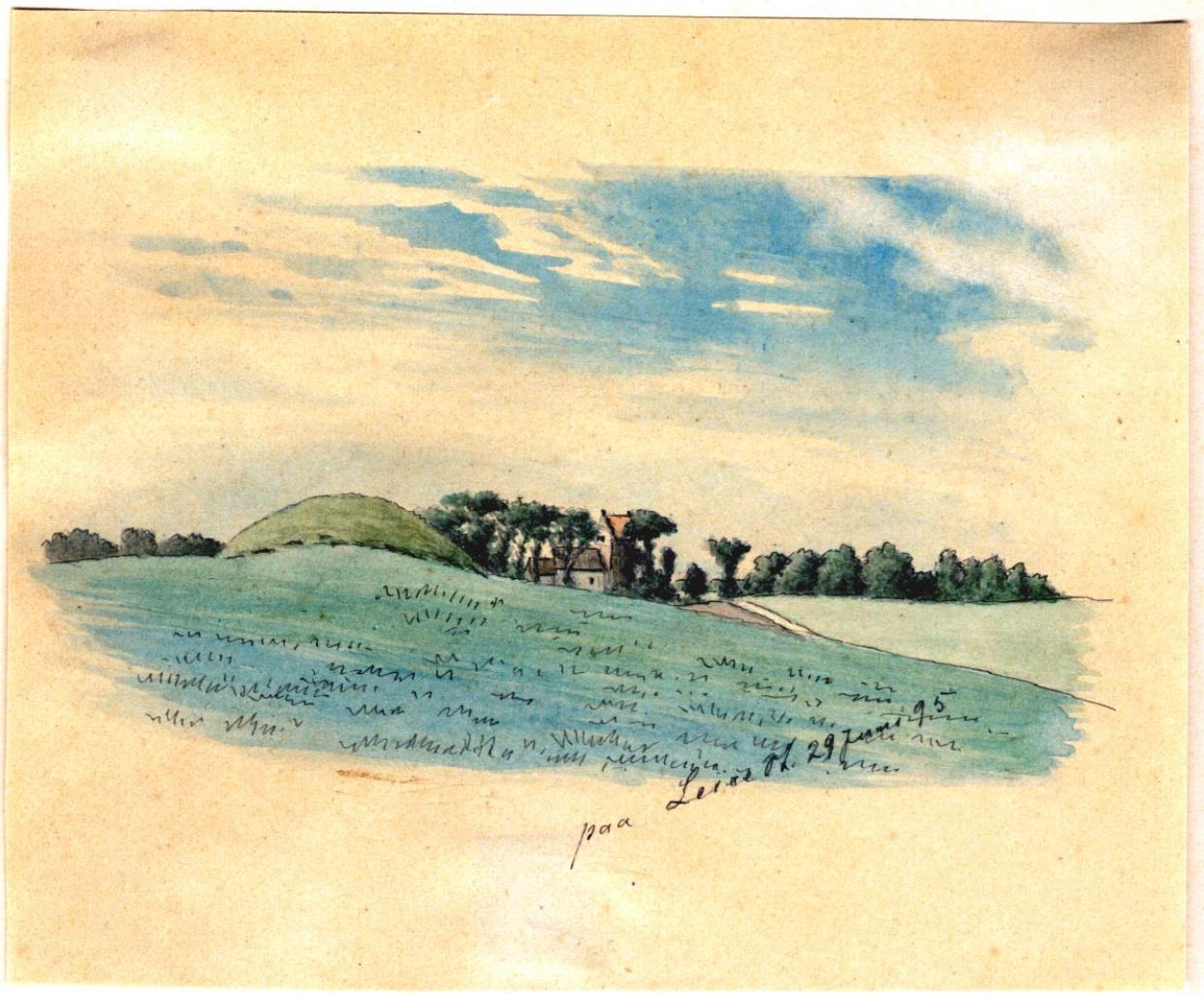
Allerslev med kirken set fra Lejre Station den 29 juni 1895 malet af Christian Bayer. Højen i forgrunden må være Hvilehøj (Tårnhøj).