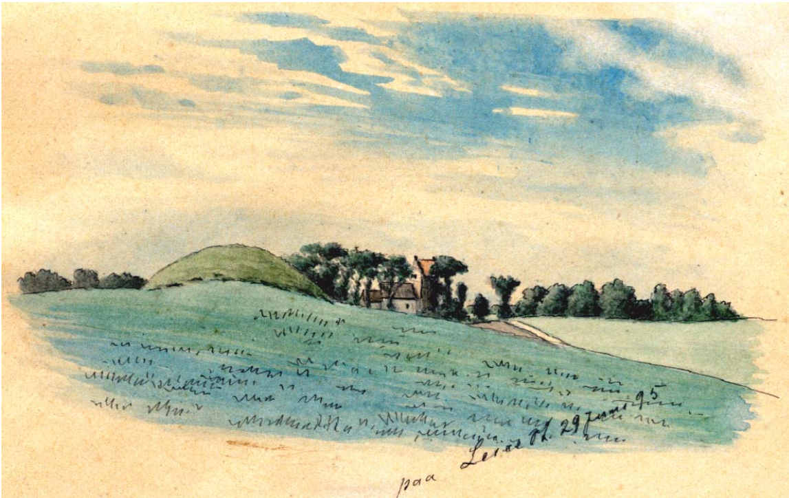
Allerslev med kirken set fra Lejre Station den 29 juni 1895 malet af Christian Bayer. Højen i forgrunden må være Hvilehøj.