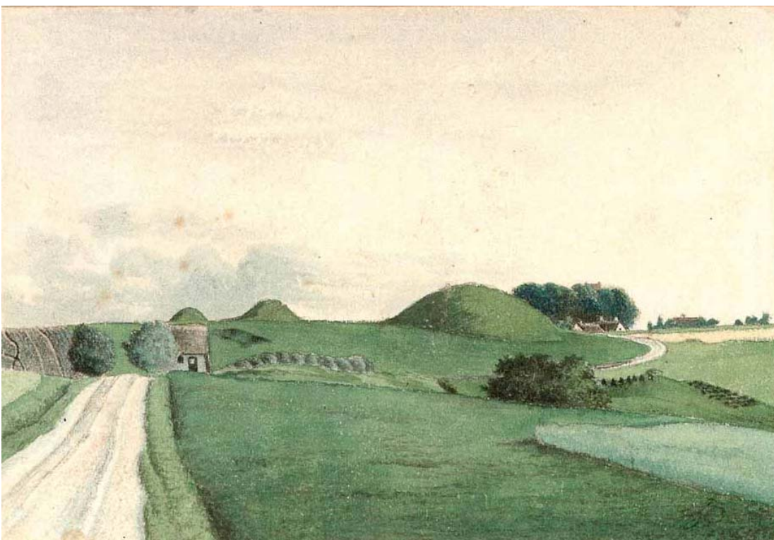
Udsigt fra Gl. Lejre mod Allerslev. Den store høj t.h. er Taaringebjerg eller Taarnbjerg. Den forsvandt sammen med endnu en høj ved anlæggelse af jernbanen. En af de små høje i baggrunden må være Hvilehøj. Billedet er malet før jernbanen blev anlagt.