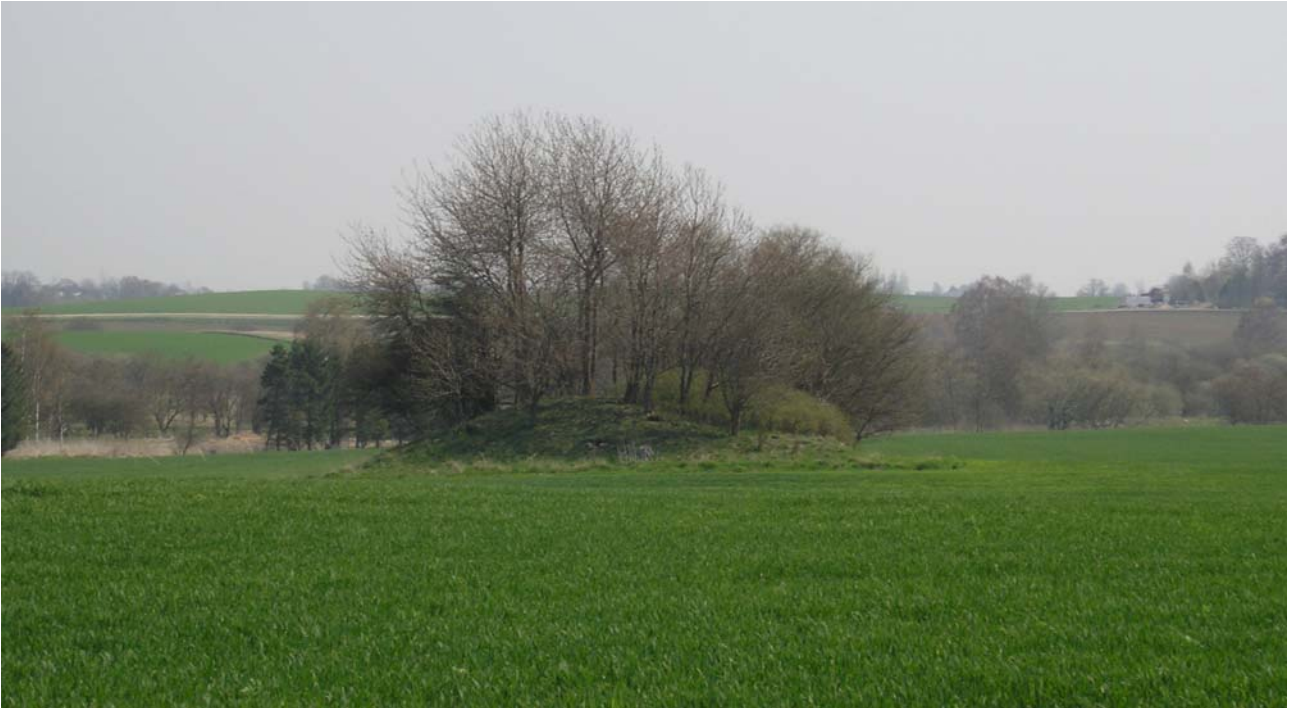
Gravhøj fra Bronzealder, firkantet afpløjet, afladnet, uregelmæssig form. 20 x 20 x 2,5 m.

Fredningsnummer 3326-24 Sognebeskrivelse 020601-78