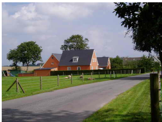
Statshusmandsbrugene på Skullerupvej.