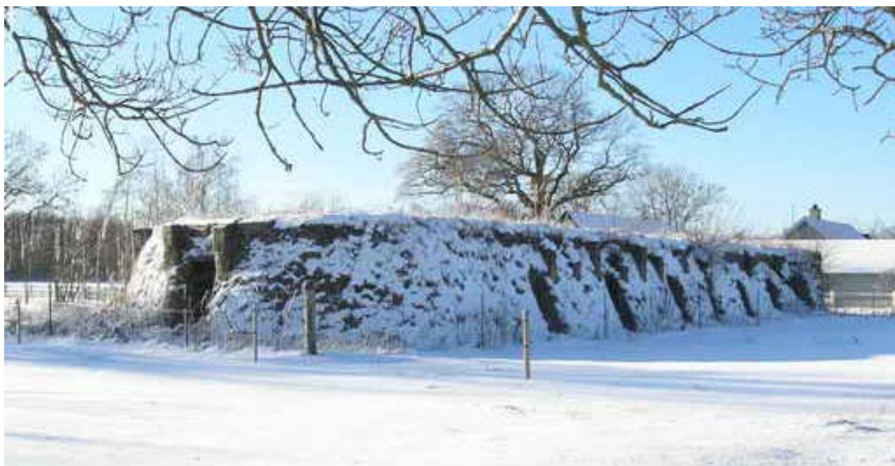
Ringovnen er fra omkring 1900. Den havde 16 dørhuller og var oval.

Teglværket blev nedlagt efter branden i 1965.