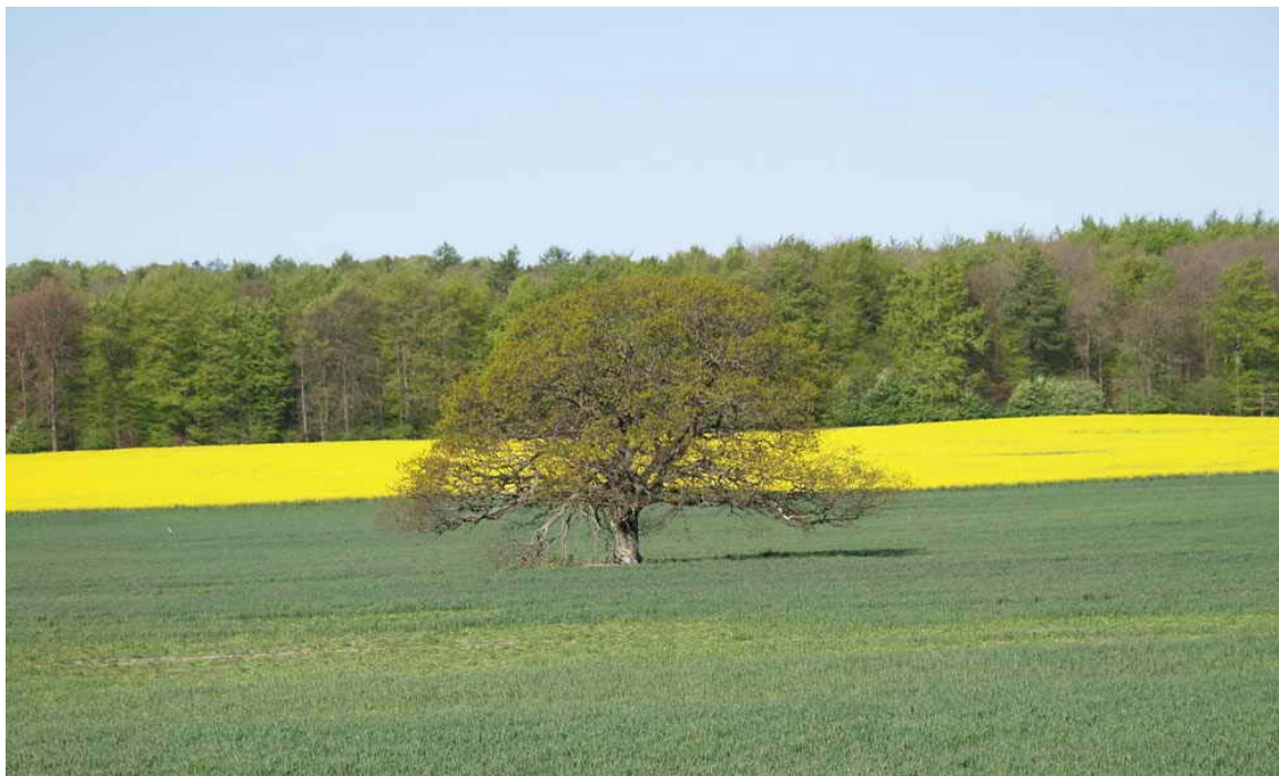
Kongeegen plantet af Kronprins Christian, den senere Kong Christian den X.