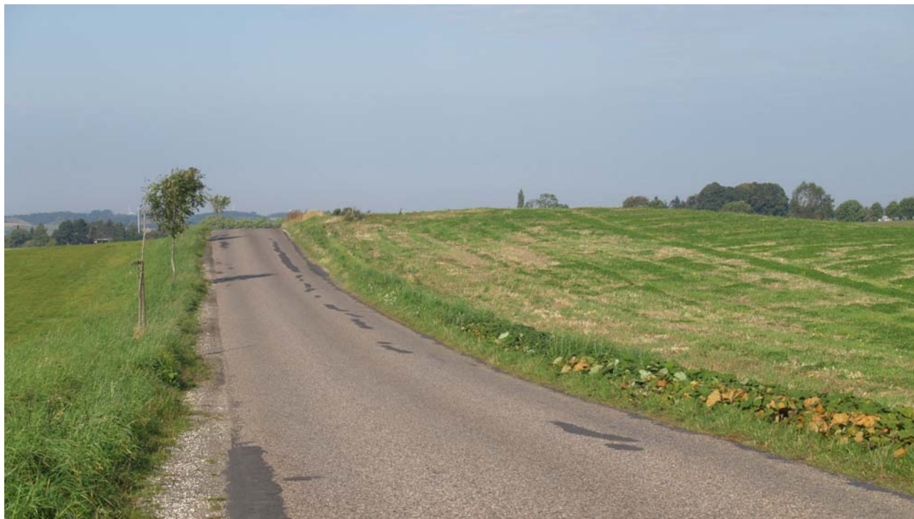
Vejen fra Glim mod alléen går delvis over en overpløjet høj