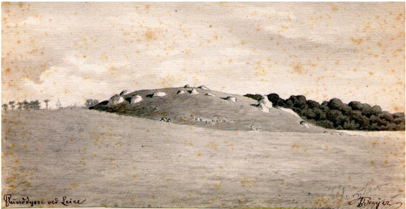
Dyssen set fra øst. Tegning af Chr. Bayer med følgende tekst: Runddysse på Allerslev mark ødelagt ved banens anlæg 1875.