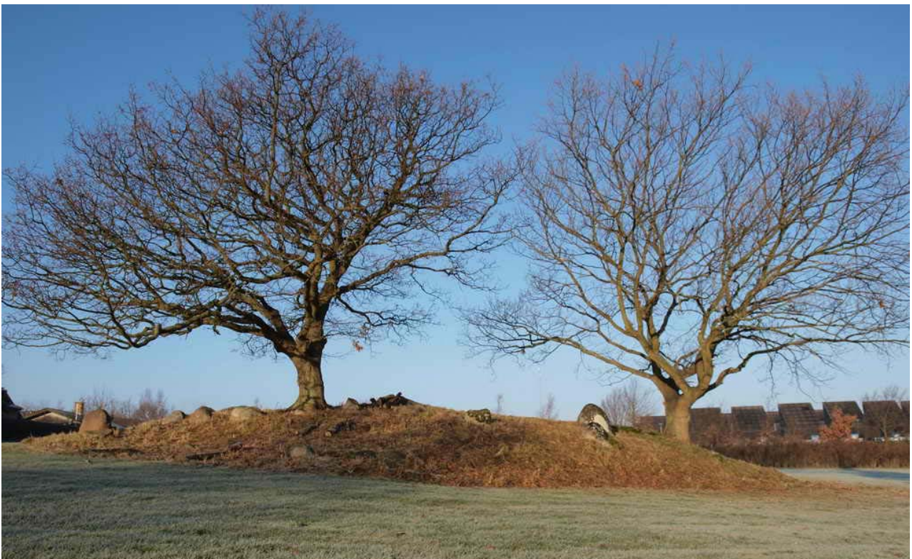
Bortset fra de to egetræer ser langdysen ud som da Chr. Bayer tegnede den i 1875.