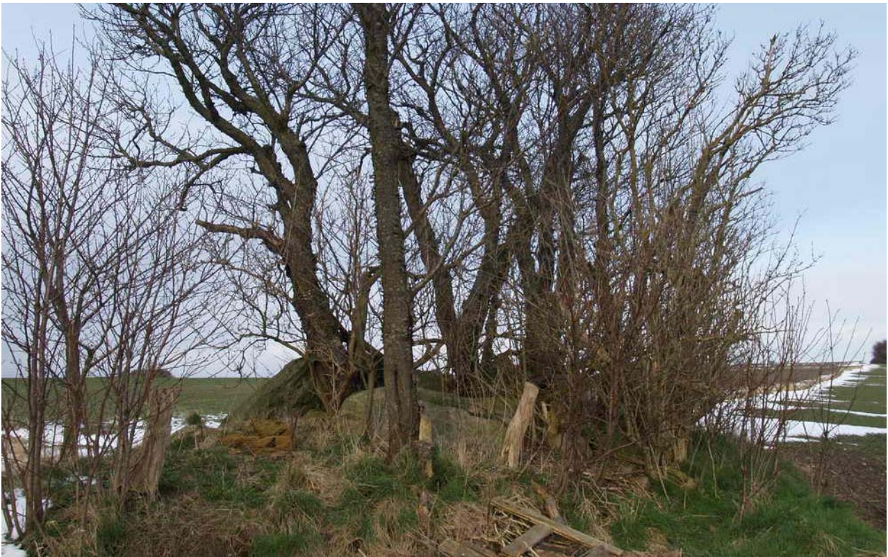
Runddysse med kammer af 5 bæresten og en væltet dæksten. 11 x 6 x 1 m

Fredningsnummer 322610 Sognebeskrivelse 020607-24