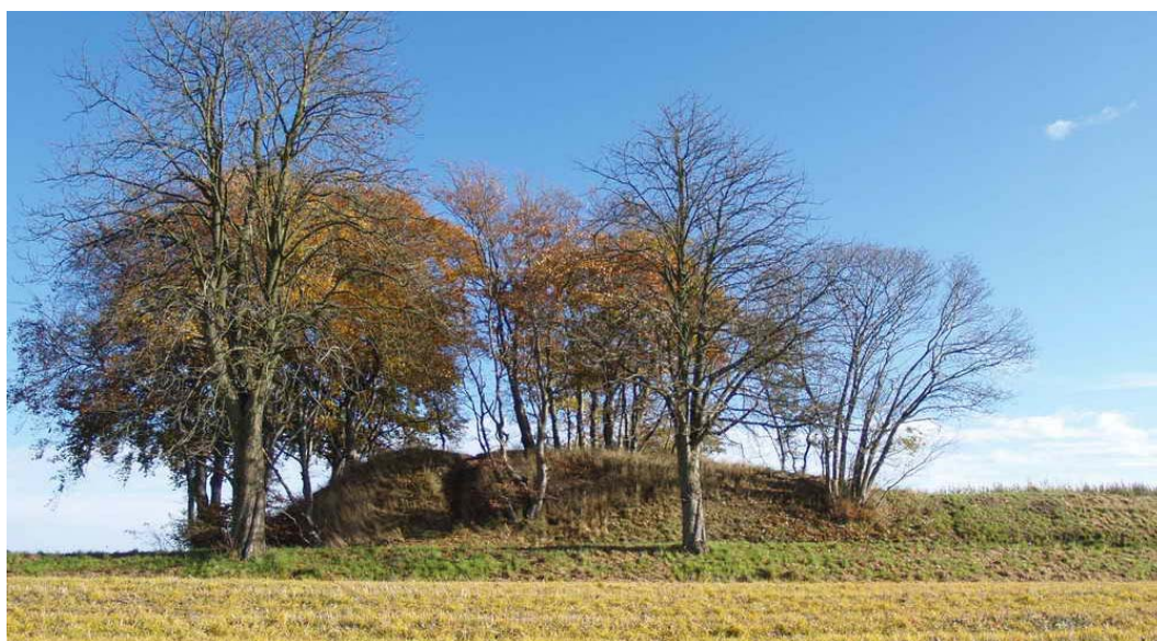
Højen set fra vest, hvor vejen ligger mellem de to vejtræer og højen.