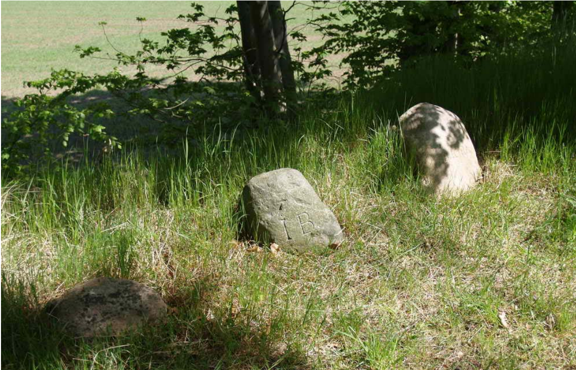
På Sofiehøj står 3 sten med navnene Henny?, Ib og Bjørn. Det er minde over tre jagthunde, som en skovfoged fra Krabbesholm havde.