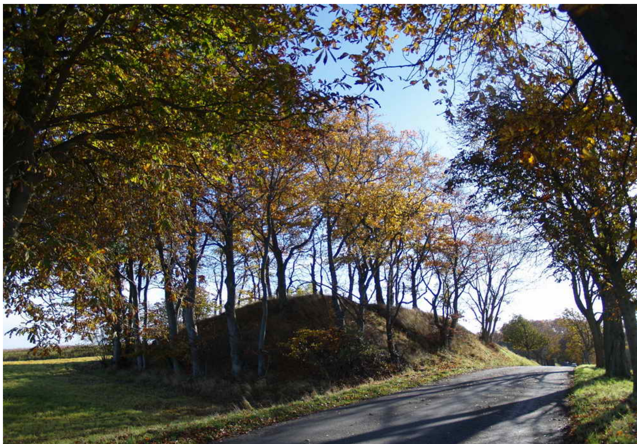
Gravhøj fra bronzealder 1.400 f. Kr. 25 x 20 x 3 m. Afravet mod nord. Mod vest skåret af vej, trappe mod vest til top, afladet top.

Fredningsnummer 312613 Sognebeskrivelse 020612-02