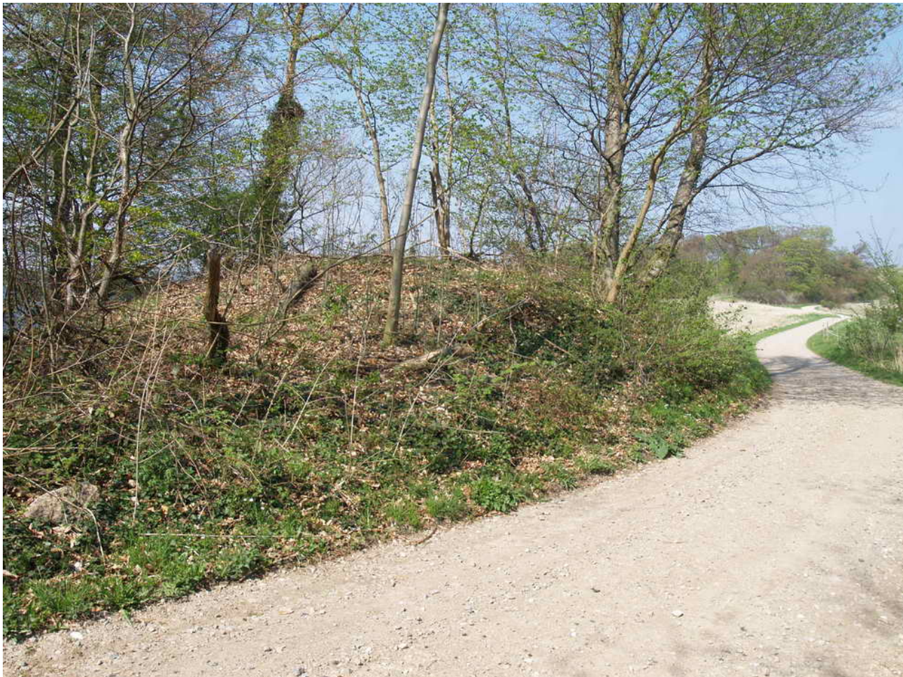
Gravhøj fra bronzealder eller ældre jernalder. 12 x 12 x 1,5 m. afgravet mod øst ved privat vej mod Bramsnæs.

Fredningsnummer 312545 Sognebeskrivelse 020611-02